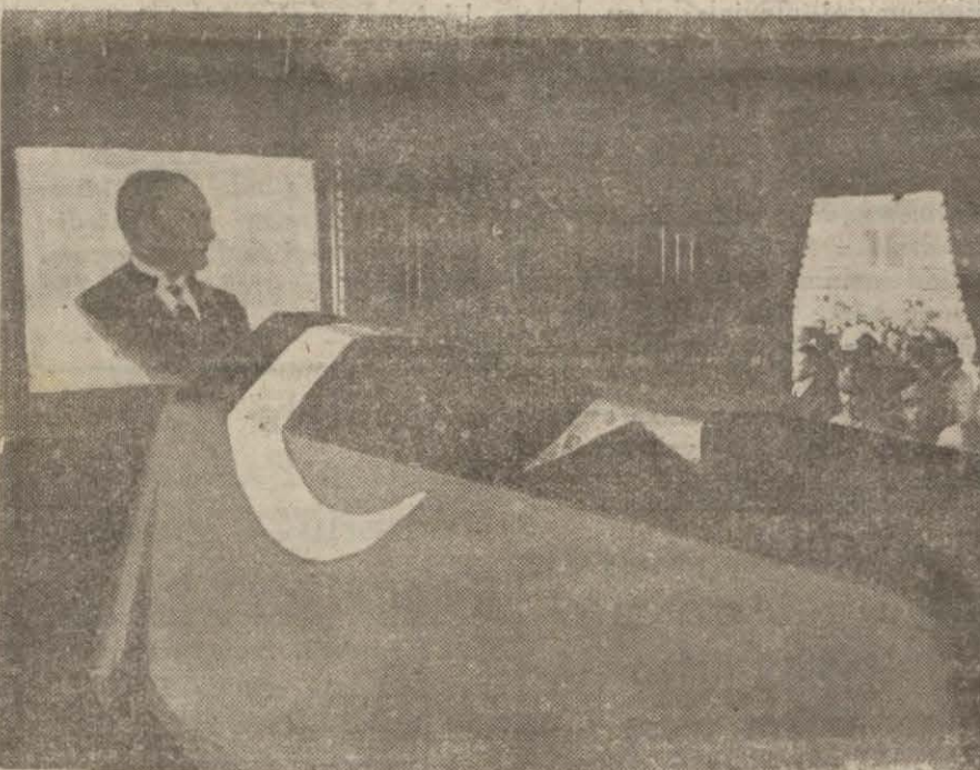
Millet hâdimi büyük vatanseverin cenazesi trene yerleştirildikten sonra Atatürk'ün resmi ile başbaşa

Hiç beklenmiyen bir zamanda anı ölümüne bütün yurdu derin bir acı içinde bırakan Başvekil Dr. Refik Saydamın cenazesi dün bü- yük ve hazin merasimle Beyoğlu Belediye hastanesinden kaldırılmış ve Haydarpaşaya geçirilerek hu- (Devamı 5 inci sayfada)